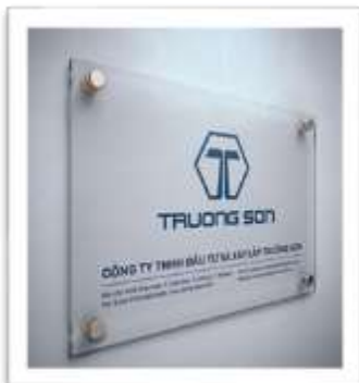
Bảng tên Công ty sử dụng ở cửa văn phòng