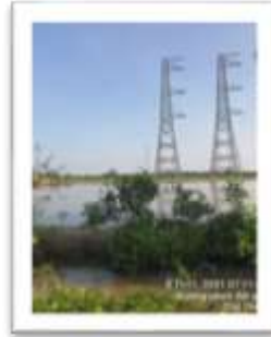
Dự án Đường dây 500kV Sông Hậu – Đức Hòa