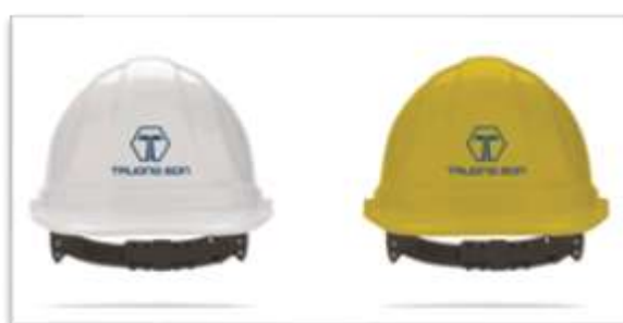
Mũ bảo hộ