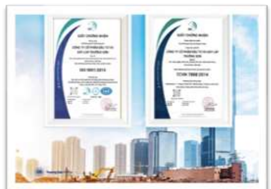
Chứng nhận quy chuẩn IQC