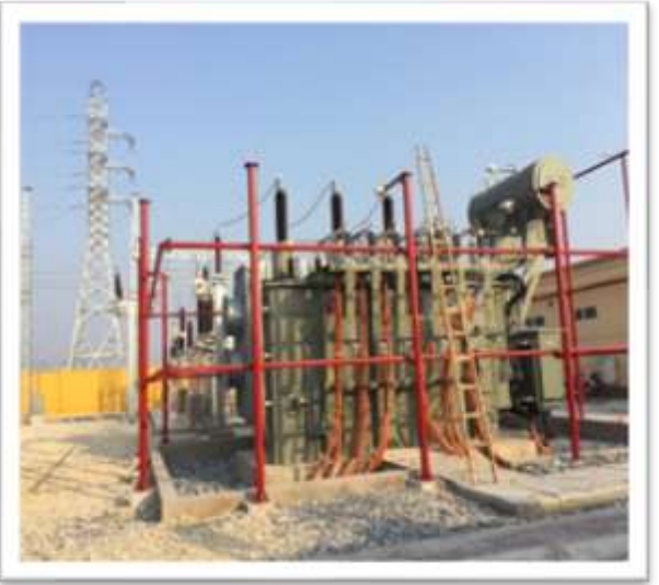
Trạm biến áp 110kV Đồng Văn 3