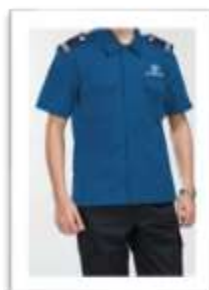
Đồng phục bảo vệ