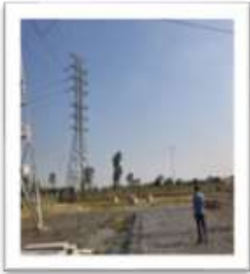
Dự án Đường dây 110kV Bá Thiện – Khai Quang