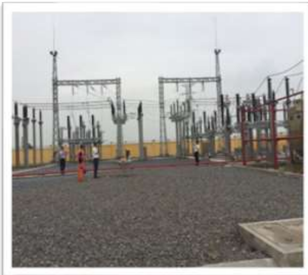
Trạm biến áp 110kV Kim Bảng