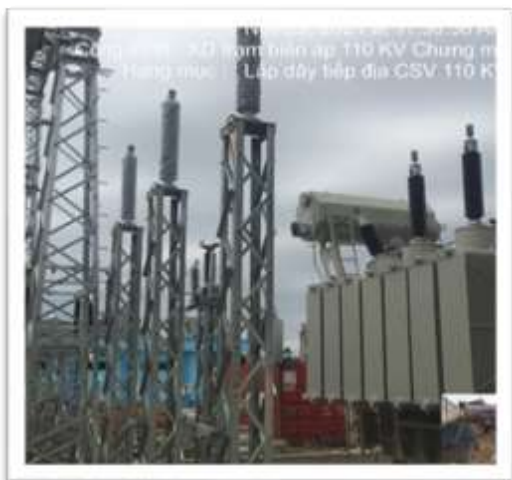
Trạm biến áp 110kV Chương Mỹ