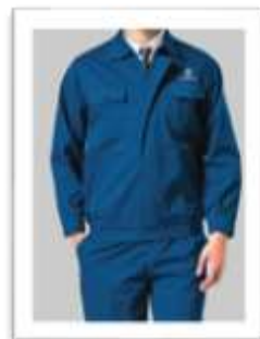
Đồng phục kỹ sư, KTV