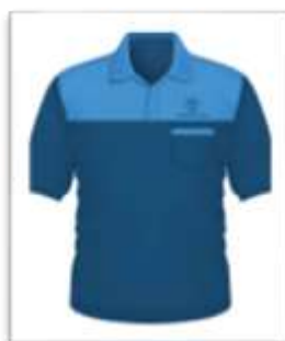
Áo phông sử dụng trong các hoạt động nội bộ của Công ty