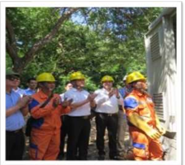
Dự án cấp điện lưới Quốc gia cho Đảo Rều, thành phố Cẩm Phả, tỉnh Quảng Ninh