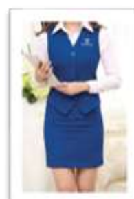
Đồng phục lễ tân