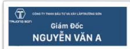
Biển chức danh