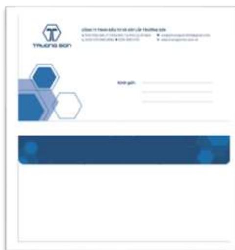
Phong bì thư sử dụng để gửi văn bản, tài liệu