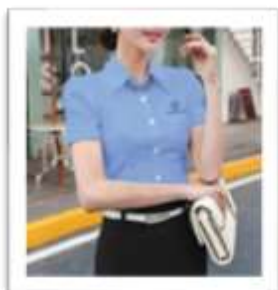
Đồng phục văn phòng