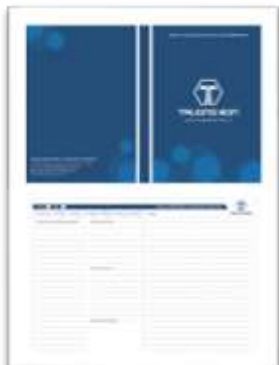
Bìa và mặt trong của sổ tay sử dụng nội bộ và làm quà tặng cho khách hàng