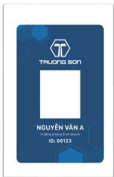
Thẻ nhân viên sử dụng trong nội bộ công ty