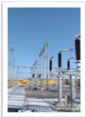
Trạm biến áp 110kV Bình Lục