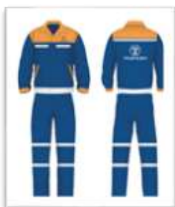
Trang phục bảo hộ