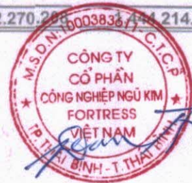
Chủ tịch Hội đồng quản trị Tsai, Chui - Tien Thái Bình, Việt Nam Ngày 30 tháng 03 năm 2025