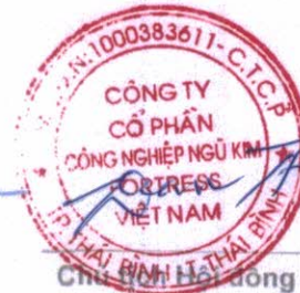
Chủ tịch Hội đồng quản trị Tsai, Chui - Tien Thái Bình, Việt Nam Ngày 30 tháng 03 năm 2025