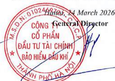
Le Tien Hung