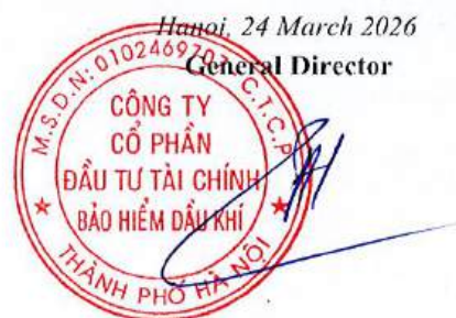
Le Tien Hung