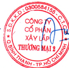
ĐINH VIỆT DUY