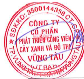
Chủ tịch Hội đồng Quản trị Lê Huy Hữu Hiệp Tỉnh Bà Rịa - Vũng Tàu Ngày 17 tháng 03 năm 2025