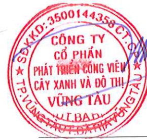
Chủ tịch Hội đồng Quản trị Lê Huy Hữu Hiệp Tỉnh Bà Rịa - Vũng Tàu Ngày 17 tháng 03 năm 2025