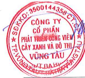
Chủ tịch Hội đồng Quản trị Lê Huy Hữu Hiệp Tỉnh Bà Rịa - Vũng Tàu Ngày 17 tháng 03 năm 2025