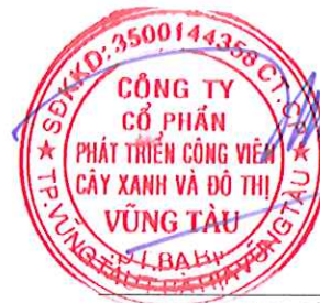
Chủ tịch Hội đồng Quản trị Lê Huy Hữu Hiệp Tỉnh Bà Rịa - Vũng Tàu Ngày 17 tháng 03 năm 2025