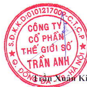
Trần Xuân Kiên