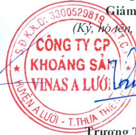
Trương Thế Sơn