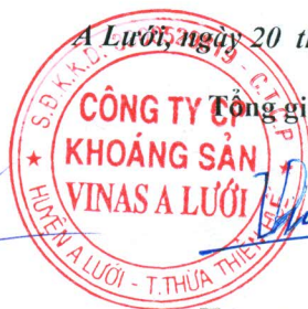
Trương Thế Sơn