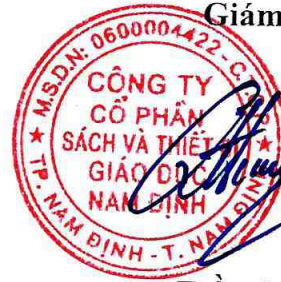
Trần Quốc Hưng