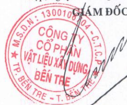
PHAN QUỐC THÔNG