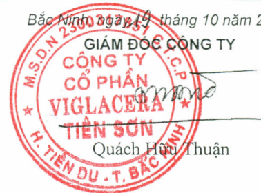
Quách Hữu Thuận