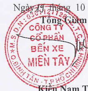
Kiều Nam Thành