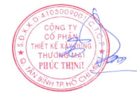
TÔ KHAI ĐẠT