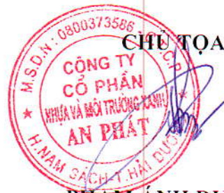
PHẠM ÁNH DƯƠNG