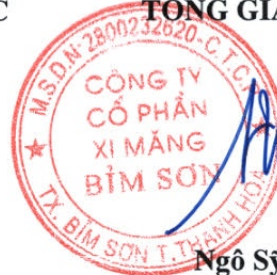
Ngô Sỹ Túc