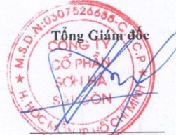
Nghiêm Phú Hùng