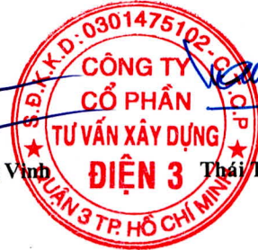
Thái Tuấn Tài