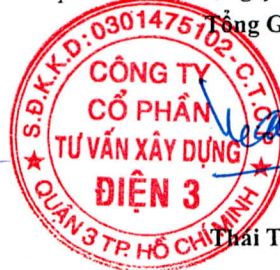
Trần Tuấn Tài