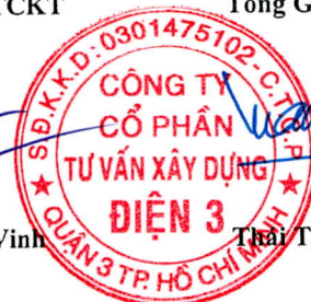
Trần Tuấn Tài