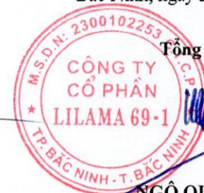
NGÔ QUỐC THỊNH