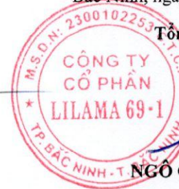
NGÔ QUỐC THỊNH