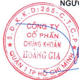
TRẦN MỸ PHÂN