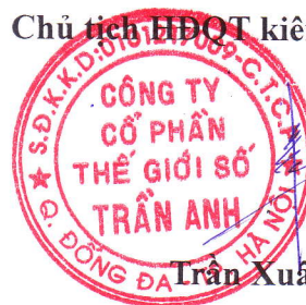
Trần Xuân Kiên