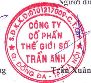
Trần Xuân Kiên