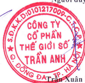
Trần Xuân Kiên