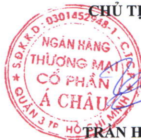
TRẦN HÙNG HUY