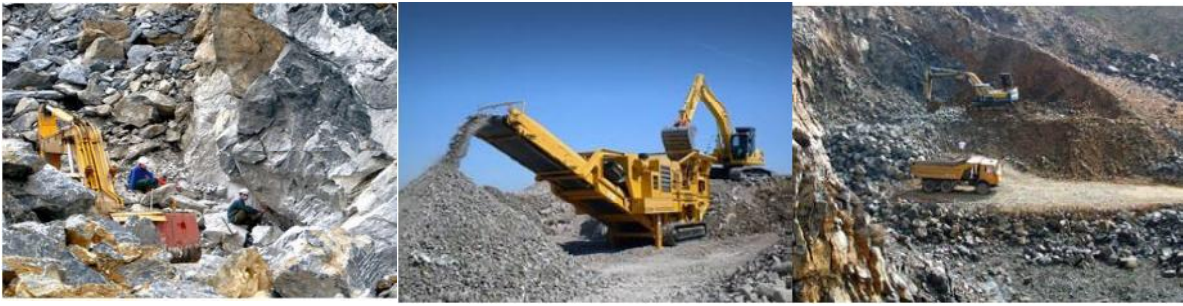
Hình ảnh: Hoạt động khai thác và chế biến đá vôi