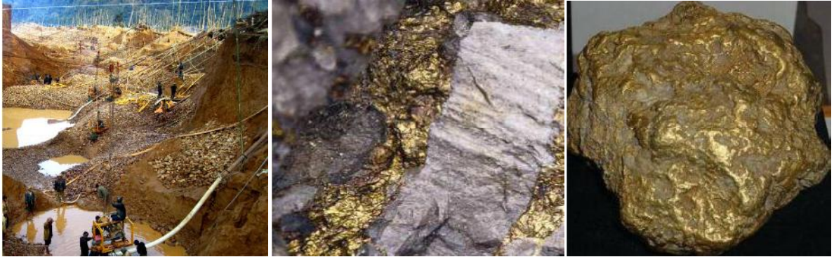
Hình ảnh: Hoạt động khai thác và chế biến vàng