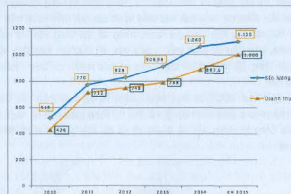
Sản lượng, Doanh thu từ 2010 - 2015