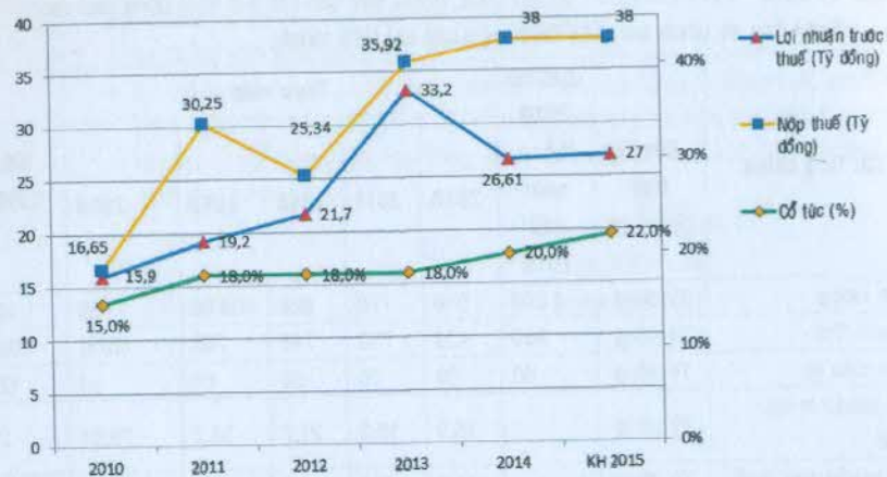
BIỂU ĐỒ TĂNG TRƯỞNG LỢI NHUẬN - NỘP THUẾ - CỔ TỨC GIAI ĐOẠN 2010 - 2015

II. Các hoạt động chính của HĐQT: Nhiệm kỳ 2010 - 2015, các thành viên Hội đồng quản trị Công ty là những người có "tầm ảnh hưởng" sâu rộng cả về uy tín, sự tin nhiệm, lẫn trình độ, năng lực, tư duy để dẫn dắt đội ngũ: