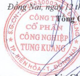
Lưu Chiến Hưng