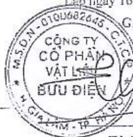
Tô Chí Thành