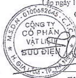
Tô Chí Thành