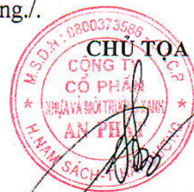
PHẠM ÁNH DƯƠNG