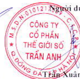
Trần Xuân Kiên