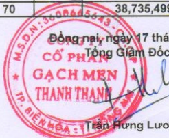
Trần Hưng Lương