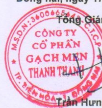
Trần Hưng Lương