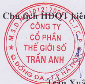
Trần Xuân Kiên