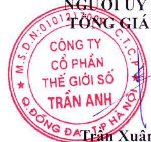
Trần Xuân Kiên