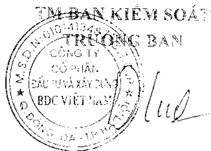
Trần Diệu Linh

Từ những phân tích và đánh giá trên Ban kiểm soát thông nhất với báo cáo tài chính năm 2014 của Công ty đã kiểm toán và nhận thấy năm 2014 Công ty đã cố gắng vượt qua khó khăn, ổn định sản xuất kinh doanh, đạt hiệu quả nhất định, tự tích lũy để bảo toàn và phát triển vốn có khả năng trang trải nợ, đảm bảo đời sống CBCNV