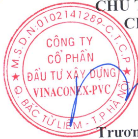
Trương Quốc Dũng