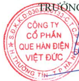
Ngô Bá Việt