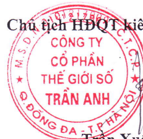
Trần Xuân Kiên