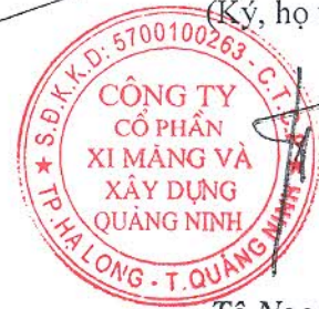
Tô Ngọc Hoàng

Ghi chú: Những chỉ tiêu hoặc nội dung đơn vị không có số liệu hoặc thông tin thì không phải trình bày và không được đánh lại số thứ tự chỉ tiêu và “Mã số”.