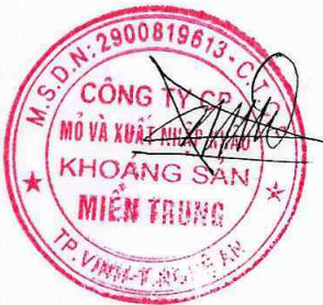
Trần Xuân Đạt