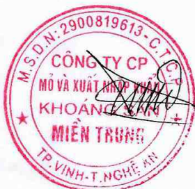
Dương Ninh Tùng