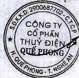
Thái Phong Nhã