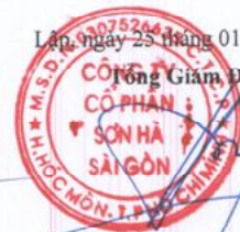
Nghiêm Phú Hùng