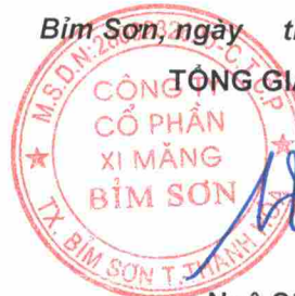
Ngô Sỹ Túc