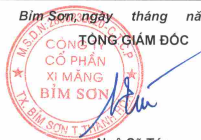
Ngô Sỹ Túc