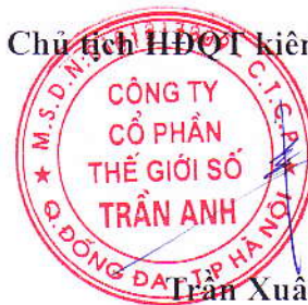
Trần Xuân Kiên