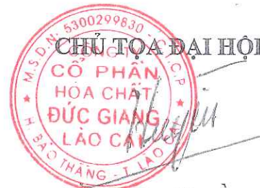
Đào Hữu Huyền