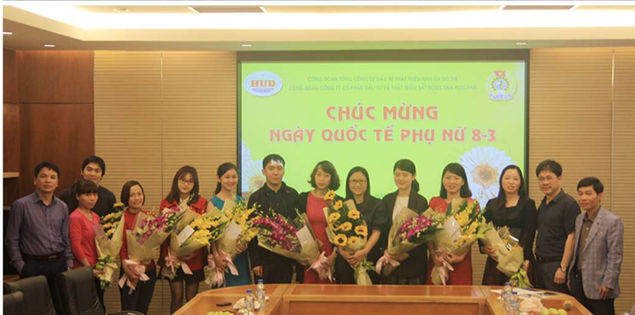
Công ty luôn quan tâm đến đời sống của cán bộ công nhân viên