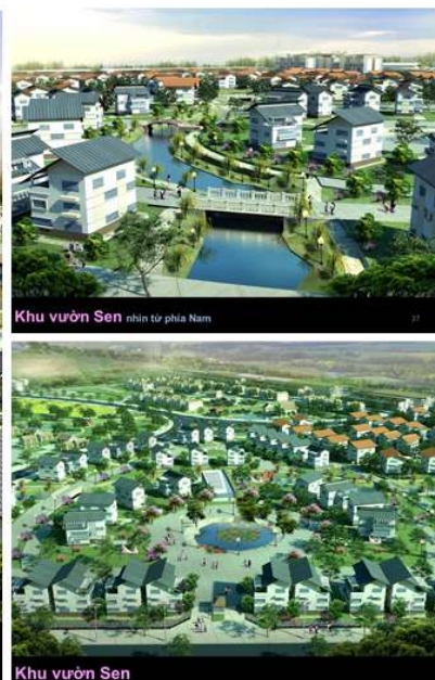
Khu dân cư mới huyện Bình Giang

- ĐTXD cụm công nghiệp làng nghề - đô thị tại thị xã Từ Sơn, Tỉnh Bắc Ninh: Hoàn thành công tác định giá dự án; xin chủ trương của Tổng Công ty, HĐQT Công ty HUDLAND về việc mua lại cổ phần chi phối tại dự án.