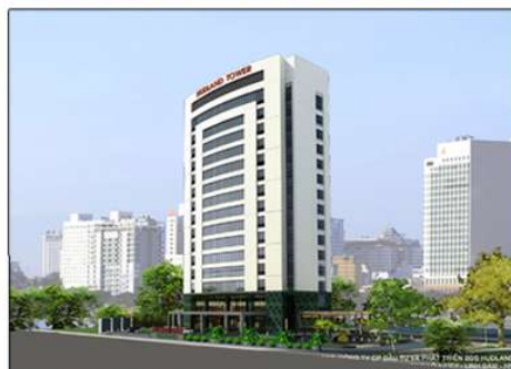
Phối cảnh dự án tòa nhà Hudland Tower

- Dự án tòa nhà Hudland Tower, khu dịch vụ tổng hợp hồ Linh Đàm, Hà Nội: Công ty đã thực hiện hợp đồng mua bán tài sản với Công ty HUD2, thu hồi đất của Công ty HUD2 giao Công ty HUDLAND, ký kết hợp đồng thuê đất giữa Công ty HUDLAND với Sở TNMT HN, triển khai công tác đầu tư hoàn thiện để nhanh chóng đưa vào sử dụng..