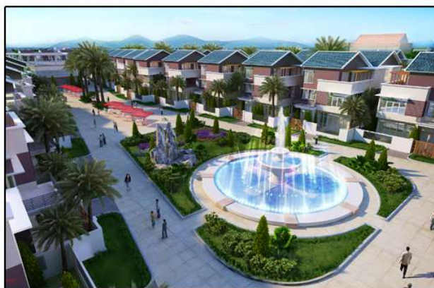
Quy hoạch tổng thể và các mẫu nhà của dự án khu B - đường Lê Thái Tổ - Bắc Ninh

- Dự án Nhà thu nhập thấp Bắc Ninh: đã hoàn thành tiền chuyển nhượng dự án với Tổng công ty, hoàn thành lập PA điều chỉnh thiết kế phù hợp với điều chỉnh quy hoạch 1/500 đang điều chỉnh của khu B-Bắc Ninh.