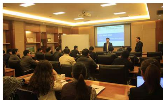
Các khóa đào tạo về chuyên môn

- Chính sách đào tạo: Luôn chú trọng đến công tác đào tạo, bồi dưỡng đội ngũ cán bộ có trình độ lao động chất lượng cao, đáp ứng nhu cầu ngày càng phát triển của công ty và xã hội.