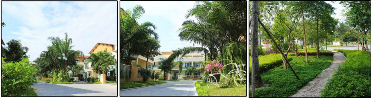
Các công trình hướng tới không gian xanh.