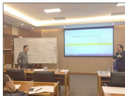
Công ty tổ chức các khóa đào tạo chuyên môn

Công tác đào tạo: tổ chức các lớp nâng cao kiến thức, nghiệp vụ chuyên môn, nâng cao trình độ quản lý, bồi dưỡng tạo nguồn nhân lực cho Công ty.