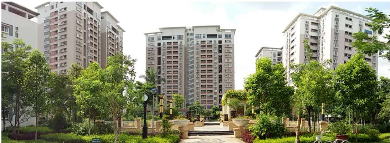
khu chung cư Green House

2.2.2. Hoạt động chính của Công ty trong năm là đầu tư phát triển khu dân cư và khu đô thị mới.