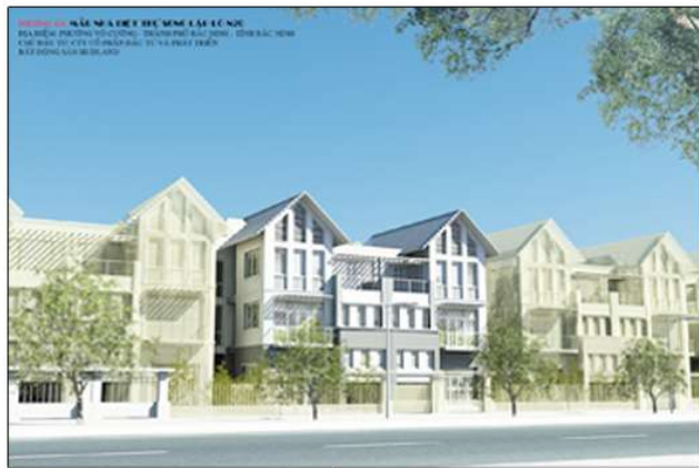
Quy hoạch tổng thể và các mẫu nhà của dự án khu A - đường Lê Thái Tổ - Bắc Ninh

- Dự án CT-17 Khu ĐTM Việt Hưng – Hà Nội: Hoàn thiện, kinh doanh và bàn giao nhà cho khách hàng mua các căn hộ thuộc 2 tòa nhà 17 tầng (GH5&GH6) cùng hệ thống HTKT, cảnh quan xung quanh khu vực, hạng mục bê bối đưa vào sử dụng;