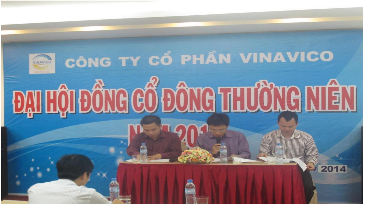
Họp Đại hội đồng cổ đông thường niên năm 2014

2.1 Đại hội đồng cổ đông: Là cơ quan có thẩm quyền cao nhất của VINAVICO, có quyền quyết định cơ cấu tổ chức hoặc tổ chức lại, giải thể doanh nghiệp; quyết định các kế hoạch đầu tư dài hạn và chiến lược phát triển; quyết định cơ cấu vốn và mua bán tài sản có giá trị từ 50% tổng giá trị tài sản trở lên; quyết định mức chi trả cổ tức, phát hành cổ phiếu và trái phiếu; bổ nhiệm và bãi miễn các thành viên Hội đồng quản trị