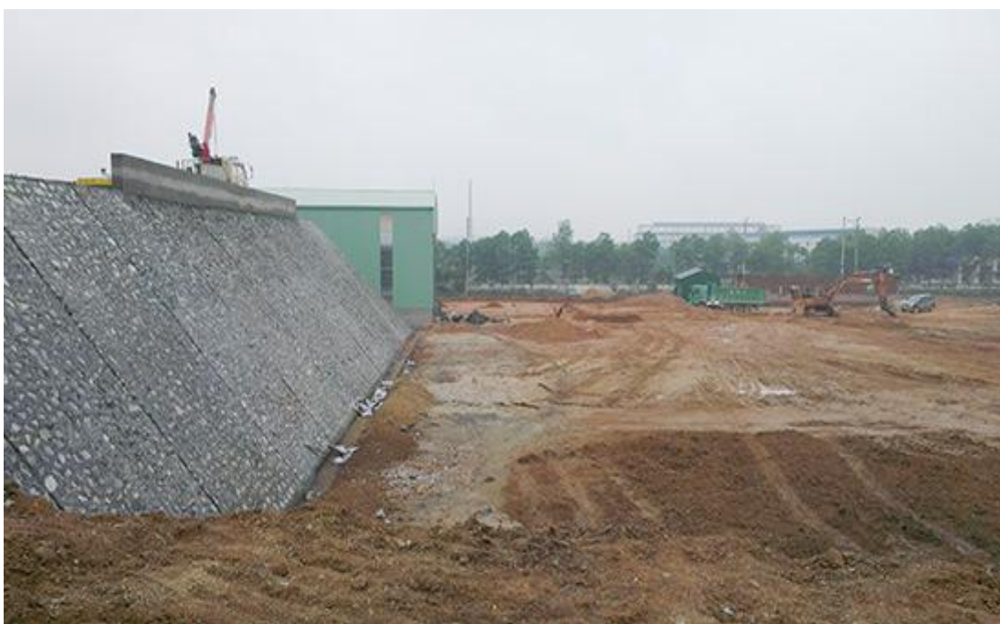
Toàn cảnh nhà máy