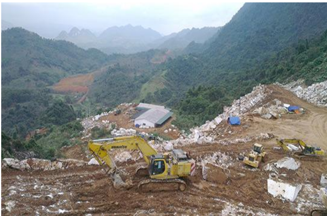
Khai thác nguyên liệu từ mỏ của công ty