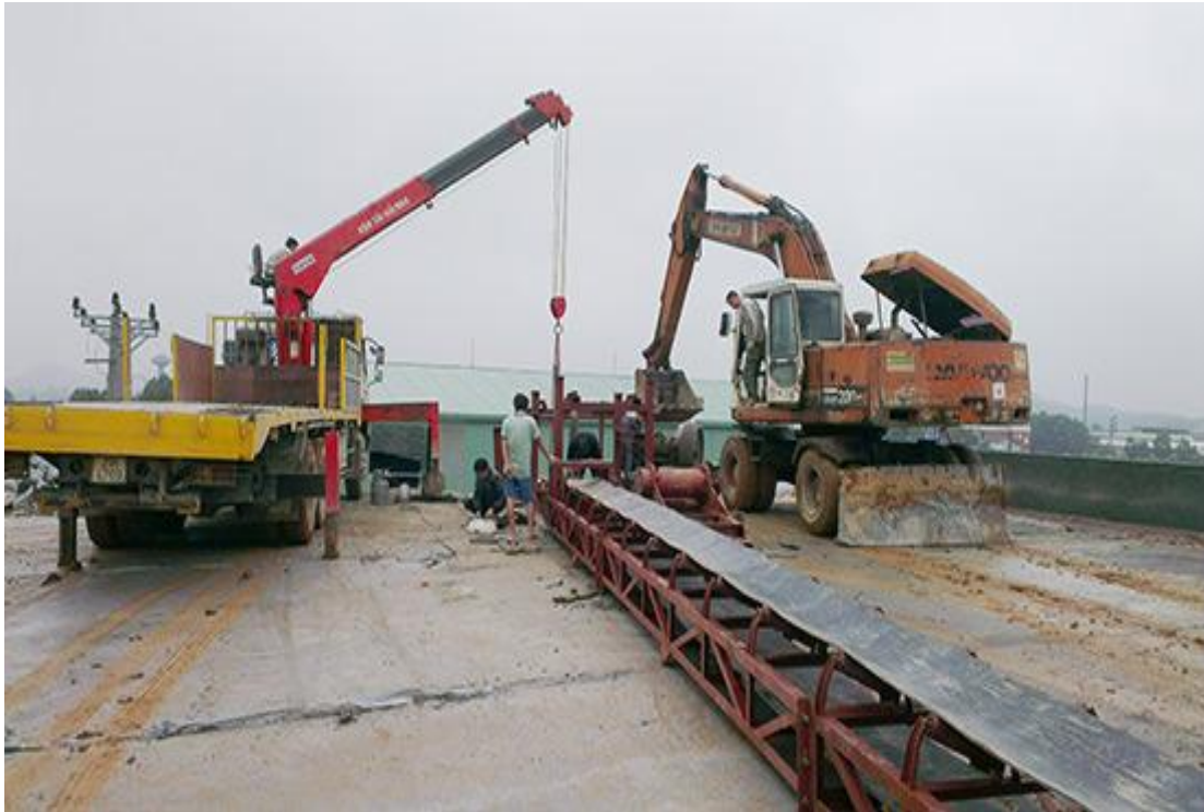
Lắp đặt băng tải chuyển nguyên liệu

Trong năm 2016, Hệ thống máy nghiền và nhân sự đã hoạt động một cách ổn định đã cung cấp cho thị trường 80.000 tấn/ năm. Thương hiệu bột đá VNS của Công ty Cổ phần Vinavico đã có chỗ đứng trên thị trường xuất khẩu từ năm 2014. Với việc đưa nhà máy nghiền bột đi vào hoạt động công ty sẽ tăng đáng kể sức cạnh tranh cũng như khả năng gia tăng lợi nhuận nhờ quy trình khép kín từ khai mỏ tới chế biến và xuất khẩu trực tiếp ra nước ngoài . Về đầu tư dài hạn, cũng trên diện tích 3ha mà công ty được cấp tại khu công nghiệp phía nam Thành phố Yên Bái, trong thời gian tới sẽ đầu tư 1 dây chuyền bao bì, một dây chuyền hạt nhựa Tai can ( 80% các sản phẩm này dùng bột đá).