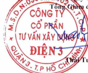
Châu Tuấn Tài