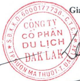
TRƯƠNG ĐỨC HÙNG