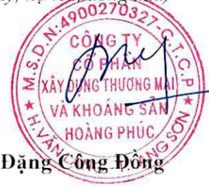
Dặng Công Đông