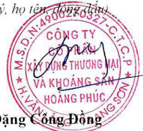
Đặng Công Đông