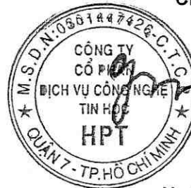
Ngô Vi Đồng