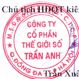
Trần Xuân Kiên