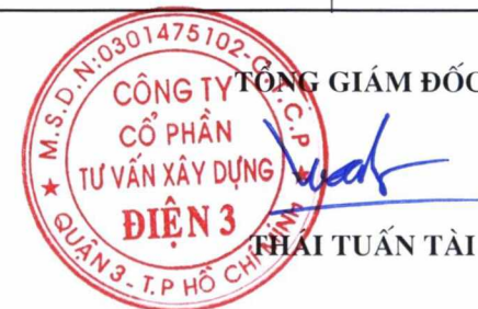
TRAI TUẤN TÀI