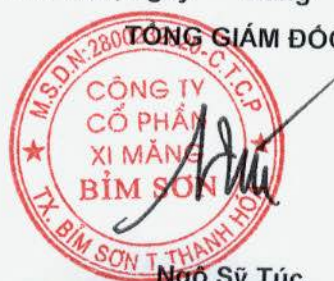
Ngô Sỹ Túc